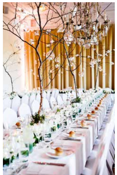
Blomsterdekorationer tillhör en av de större budgetposterna i ett bröllop. Sexsiffriga belopp är inget ovanligt.

– Den viktigaste skillnaden är att ingen religiös framtoning existerar i en borgerlig vigsel. Andra skillnader kan vara själva upplägget och innehållet. I en kyrklig vigsel sjungs