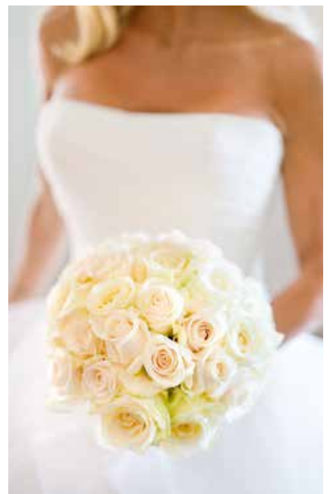
Självklart inspireras brudparen av de kungliga bröllopen i valet av buket och färgval.

– Jag ser absolut ett tydligt uppsving av bröllop somrarna efter de kungliga bröllopen. Självklart inspireras brudarna av färgval, bu-